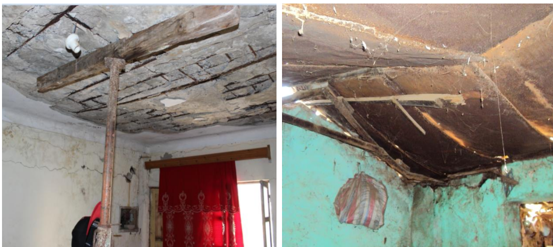
Figura 8: Habitações degradadas em Ponta d'Água

É no espaço do bairro de Ponta d'Água que de acordo com o relatório da ONG Citi Habitat já foram reabilitadas cerca de 100 casas.