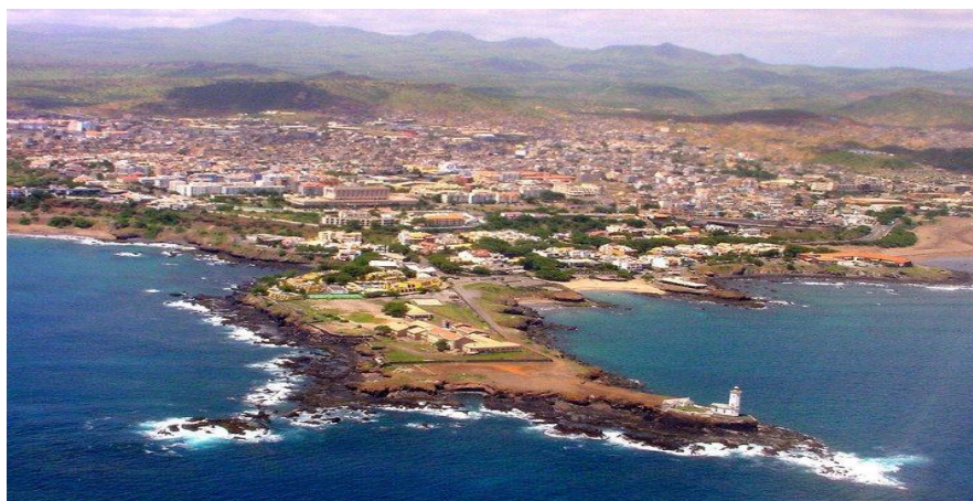
Figura 2: Foto da Cidade da Praia