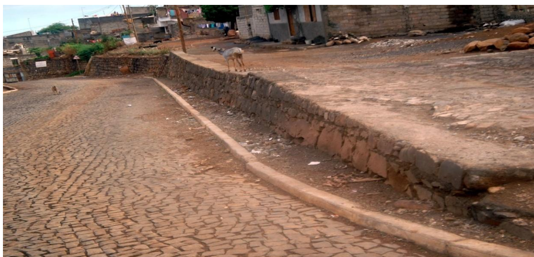
Figura 5: Foto do muro construído em Ponta d'Água

A figura em baixo representa o muro construído na subzona III do bairro de Ponta d'Água.