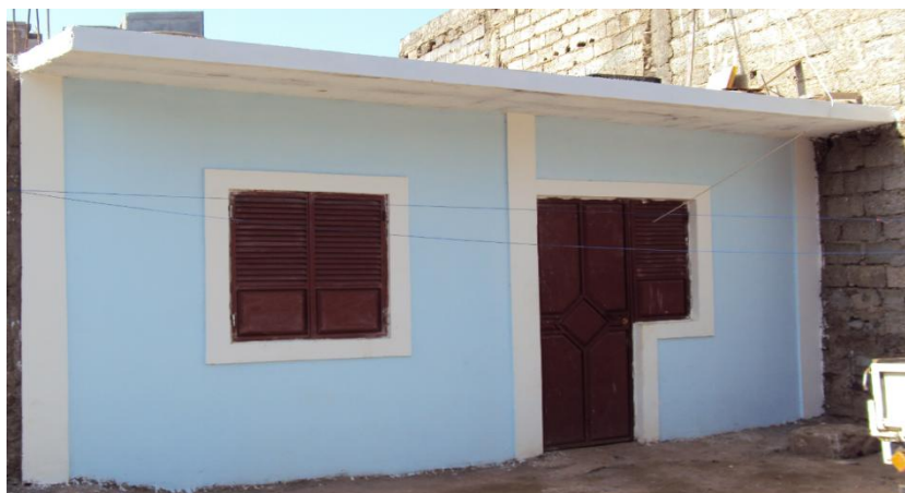
Figura 9: Casa reabilitada pela ONG Citi Habitat no bairro de Ponta d' Água

De forma geral o seu depoimento demonstra que apesar de ficar satisfeita com o apoio recebido da Citi Habitat, ela continuou a ter uma casa que não oferece todas as condições de habitabilidade, pois segundo ela não tem energia e nem casa de banho.