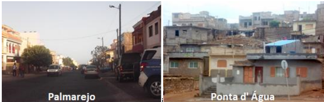
Figura 3: Fotos dos bairros de Palmarejo e Ponta d'Água

Assim no espaço urbano da cidade da Praia nota-se nos bairros uma certa homogeneidade de status do seu usuário, onde há uma forte segregação espacial. Os diferentes atores sociais usam o espaço em função dos capitais disponíveis, das estratégias e dos sentidos que atribuem a estes. Por exemplo, alberga no Palmarejo pessoas de classe alta, residindo em habitação com todas as condições de habitabilidade que por sua vez contrapõe ao tipo de habitação precária que há no bairro de Ponta d'Água (Ramos et al, 1990).