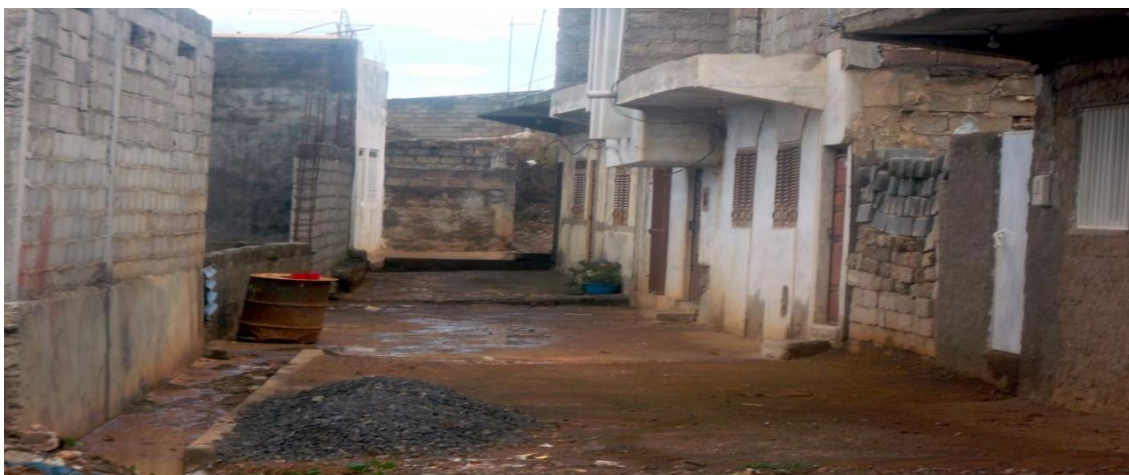
Figura 7: Características de arruamento em Ponta d' Água

problemas das redes viárias que dificultam a ligação do bairro ao resto da cidade em grande medida decorrem da ausência de um planeamento prospetivo e eficaz ao nível espacial e do sistema de transportes, que tem origem no processo expansivo do processo de ocupação de território que referimos atrás.