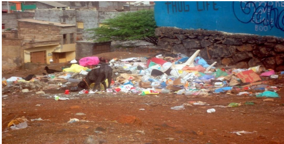
Figura 4: Foto do bairro de Ponta d'Água

Enfim, na cidade da Praia há uma grande carência e precariedade de redes artificiais de drenagem de água pluviais. No fundo a questão de saneamento continua a excluir os praienses do pleno direito à cidade.