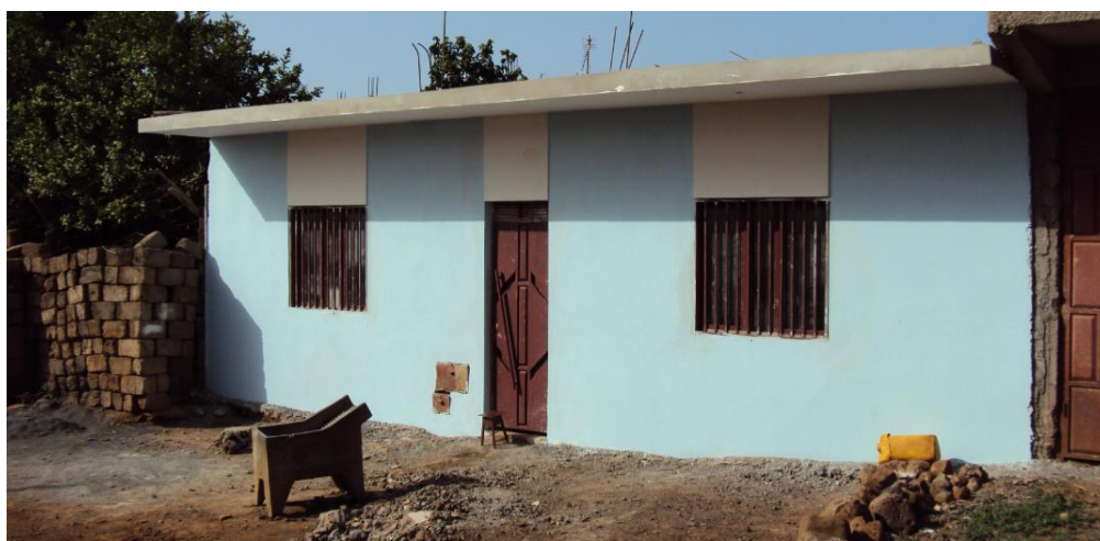
Figura 10: Outra habitação reabilitada no bairro de Ponta d' Água

Fiquei contente com o apoio da Citi Habitat, como se fosse que eu tivesse grande casa (riso), fiquei contente. Por que fiquei contente? Fiquei contente porque eu nunca tinha teto com aquela qualidade, antes a minha casa tinha pau e chapa, a forma como o meu marido tinha-a feito, no momento da chuva, água caía dentro da casa. Então chamei o meu sobrinho Victor para vir tirar alguns blocos para poder ficar desaguado. Água no momento da chuva caía dentro da casa. Então é para ver, que quando eles têm me dado ajuda para betão tinha que ficar muito contente. Mais contente ficaria se ajudassem a ter uma casa de banho (Mãezinha, beneficiária do projeto, 58 anos).