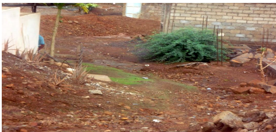
Figura 6: Foto de bairro de Ponta d'Água

A imagem seguinte representa os principais riscos ambientais, no bairro de Ponta d'Água.