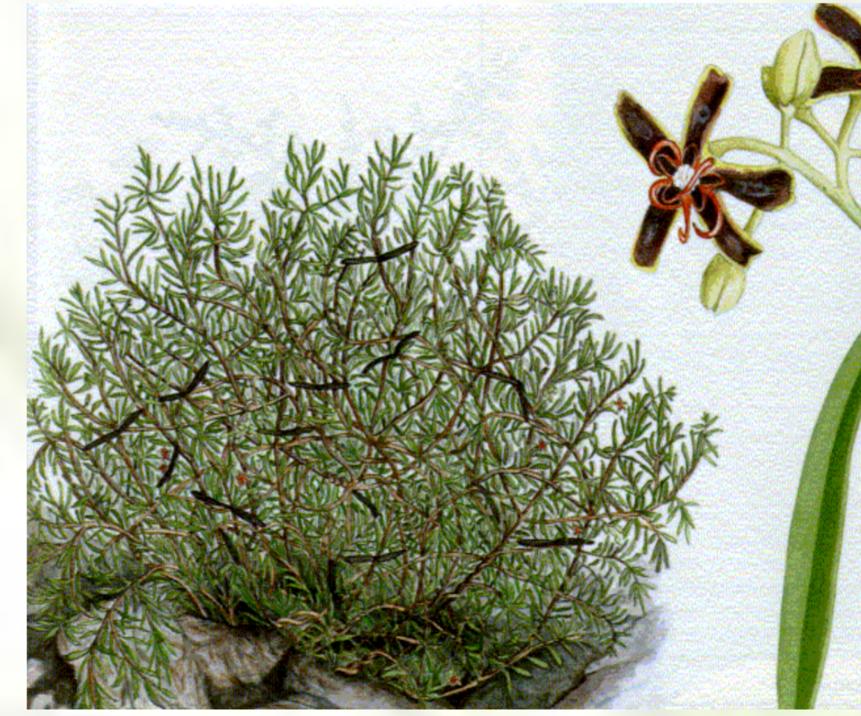
Periploca laevigata Aiton ssp. chevalieri (Browicz) G. Kunkel

NOME VULGAR: lantisco FAMÍLIA: Asclepiadaceae UTILIZAÇÃO: gripe com tosse e diabetes (parte utilizada raiz, caule e folha: xarope fervido com água e açúcar – tomar 2 x ao dia antes das refeições). DISTRIBUIÇÃO NAS ILHAS: S. Antão, S. Luzia, S. Nicolau, Santiago, Fogo e Brava.