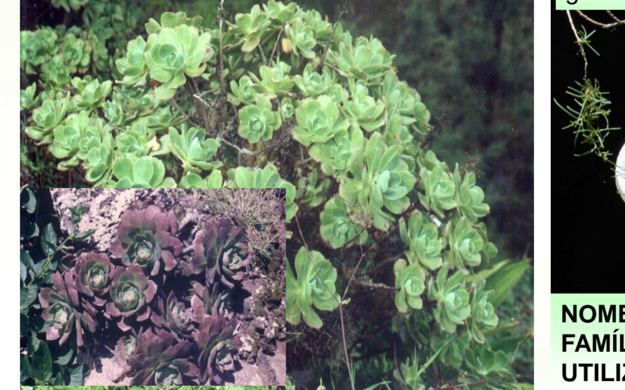
Aeonium gorgoneum J.A.Schmidt

NOME VULGAR: saião FAMÍLIA: Crassulaceae UTILIZAÇÃO: Contra tosse e pneumonia. DISTRIBUIÇÃO: S.Antão, S. Vicente, S. Nicolau.