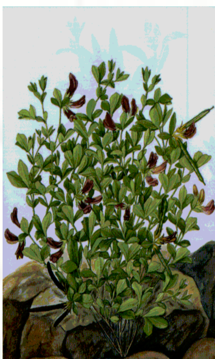
Lotus purpureus Webb

NOME VULGAR: piorno FAMÍLIA: Fabaceae UTILIZAÇÃO: febre e dores no peito e nas costas (chá – ênfase às folhas) DISTRIBUIÇÃO NAS ILHAS: S. Antão, S. Vicente, S. Luzia, S. Nicolau, Sal, Boavista, Maio, Santiago, Fogo e Brava. Nos Ilhéus Branco e Raso.