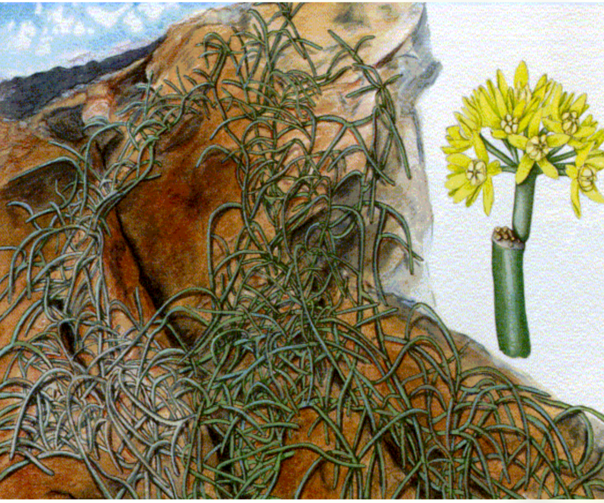
Sarcostemma daltonii Decne.

NOME VULGAR: sistiba; gestiba FAMÍLIA: Asclepiadaceae UTILIZAÇÃO: Tratamento de comichão na pele e dores de dente (fumar caule enrolado no papel conformado como cigarro) DISTRIBUIÇÃO NAS ILHAS: S. Antão, S. Vicente, S. Nicolau, Boavista, Santiago, Fogo e Brav