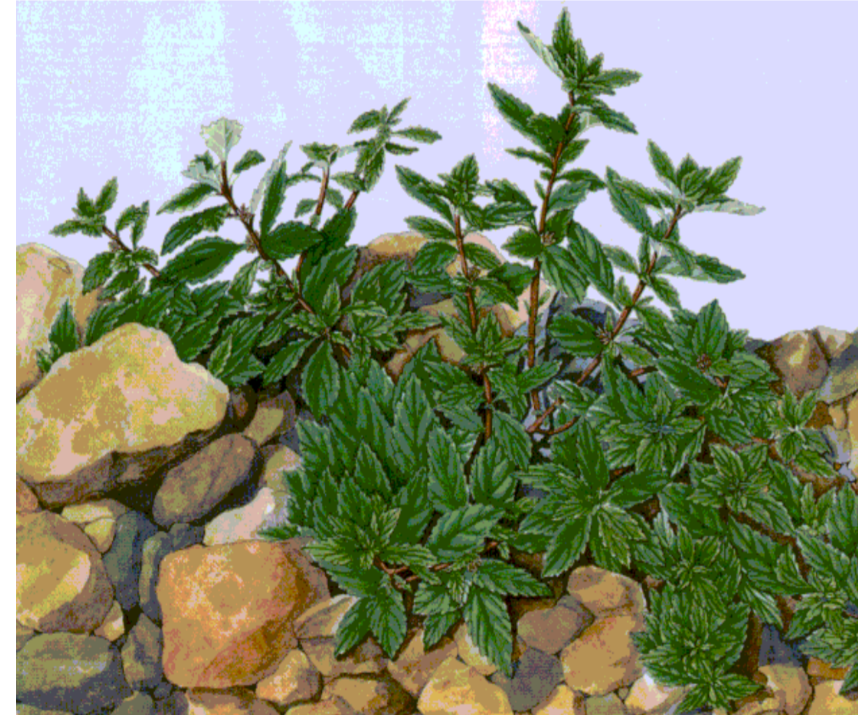
Forsskaolea procridifolia Webb

NOME VULGAR: ortiga FAMÍLIA: Urticaceae UTILIZAÇÃO: dores de dente (fumando folhas secas enroladas). A sua infusão alivia a "asma" DISTRIBUIÇÃO NAS ILHAS: S. Antão, S. Vicente, S. Luzia, S. Nicolau, Sal, Maio, Santiago, Fogo e Brava. Nos Ilhéus Branco e Raso.