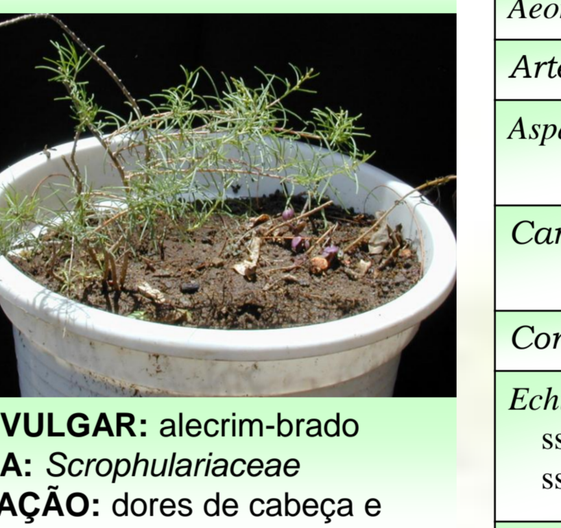
Campylanthus glaber Benth. ssp. glaber

NOME VULGAR: alecrim-brado FAMÍLIA: Scrophulariaceae UTILIZAÇÃO: dores de cabeça e perturbações menstruais. DISTRIBUIÇÃO NAS ILHAS: Santo Antão, S. Vicente, S. Nicolau, Santiago, Fogo e Brava