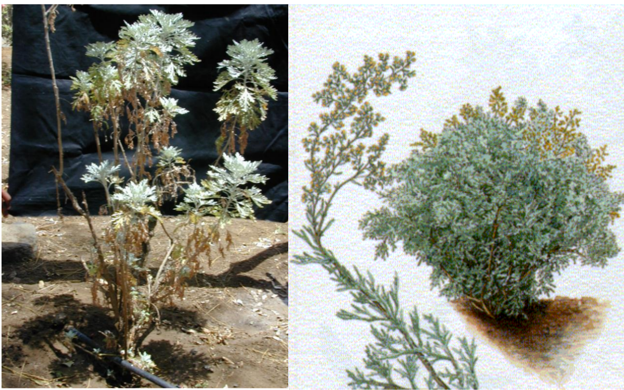
Artemisia gorgonum Webb

NOME VULGAR: losna FAMÍLIA: Asteraceae UTILIZAÇÃO medicinal: antipalúdico, febrífugo. DISTRIBUIÇÃO NAS ILHAS: Santo Antão, Santiago, Fogo.