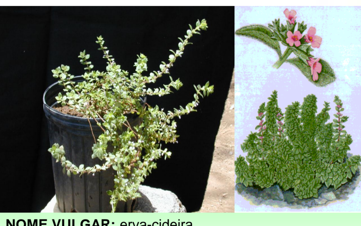
Satureja forbesii (Benth.)

NOME VULGAR: erva-cideira FAMÍLIA: lamiaceae UTILIZAÇÃO: infusão, dores de estômago e gases. DISTRIBUIÇÃO NAS ILHAS: santo antão, s. Nicolau, santiago, fogo e brava.