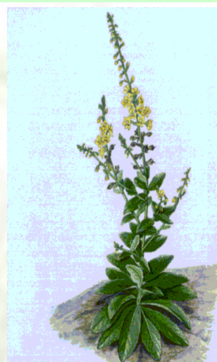
Verbascum capitis-viridis Hub.-Mor.

NOME VULGAR: sabão-de-feliceira; erva-de-s. joão FAMÍLIA: Scrophulariaceae UTILIZAÇÃO: Tratamento de febre (suco das folhas em solução aquosa, utilizada no banho) DISTRIBUIÇÃO NAS ILHAS: S. Antão, S. Vicente (extinta) S. Nicolau, Boavista (extinta), Maio (extinta), Santiago, e Fogo.