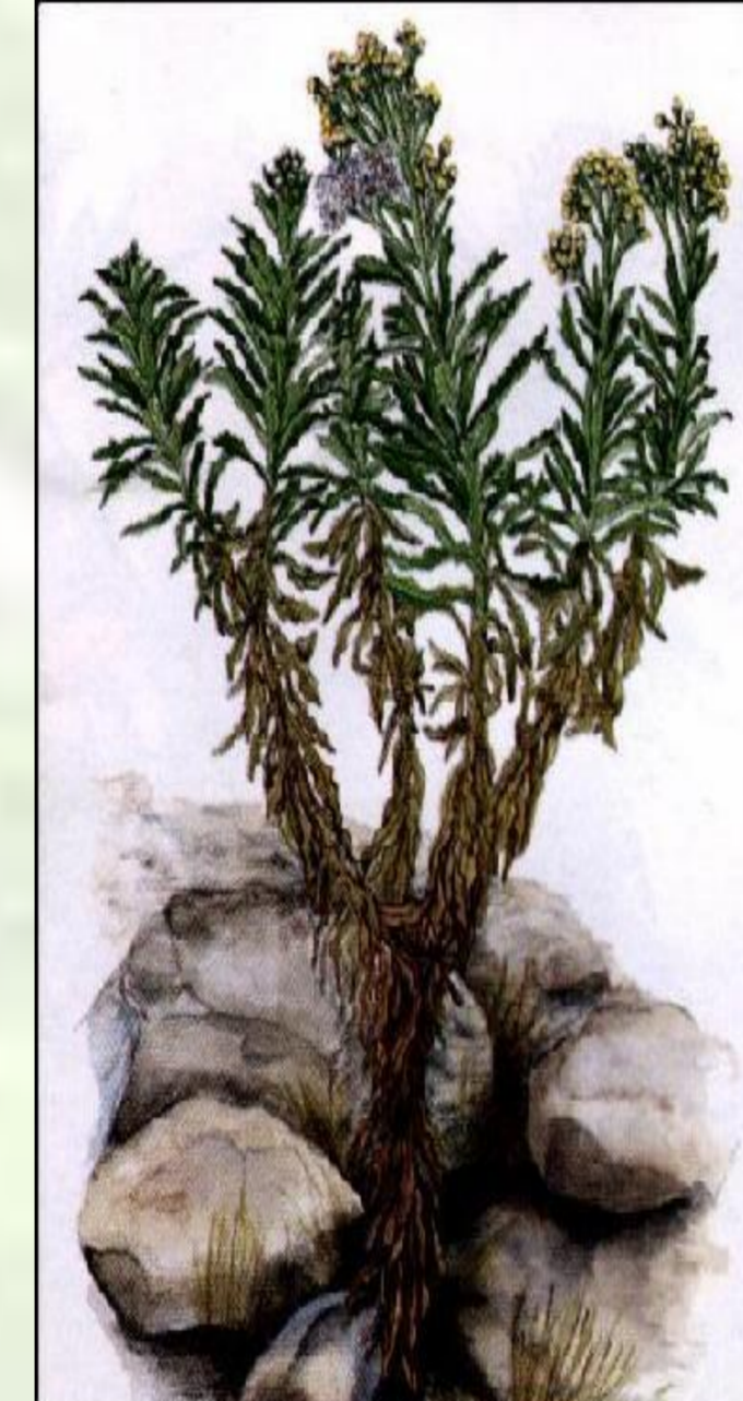
Sideroxylon marginata (Decne.) Cout

NOME VULGAR: marmolano FAMÍLIA: Sapotaceae UTILIZAÇÃO: Tratamento das fracturas ósseas e dores no corpo (cataplasma e chá – ênfase às folhas) DISTRIBUIÇÃO NAS ILHAS: S. Antão, S. Vicente, S. Nicolau, Boavista, Santiago, Fogo e Brava.