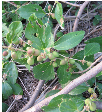
Ziziphus mauritiana (iconografia, J.Alves; imagem M.C.Duarte)