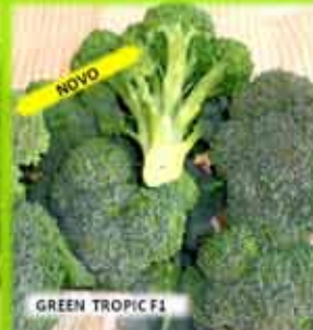
GREEN TROPIC F1