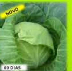
NOVO 60 DIAS