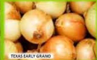
TEXAS EARLY GRANO