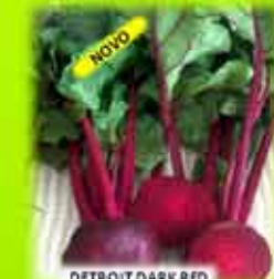
DETROIT DARK RED