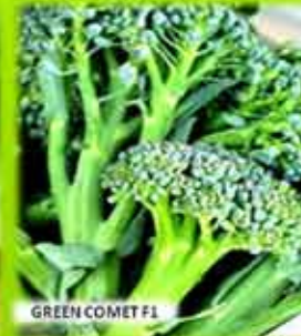
GREEN COMET F1