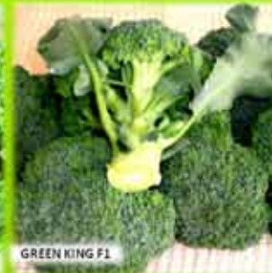
GREEN KING F1