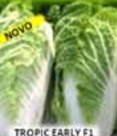
TROPIC EARLY F1