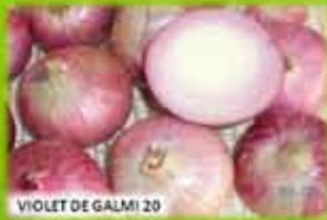
VIOLET DE GALMI 20