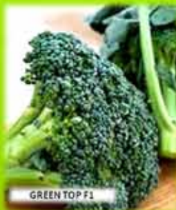
GREEN TOP F1