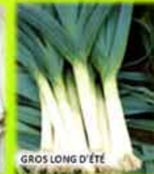
GROS LONG D'ÉTÉ