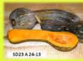
SD23 A 24-13