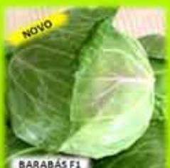
NOVO BARABÁS F1