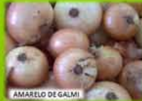
AMARELO DE GALMI